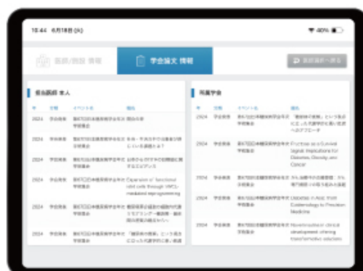
学会・論文情報（株式会社医薬情報ネット）