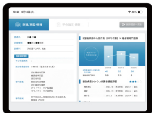
医師・施設情報（ミーカンパニー株式会社）