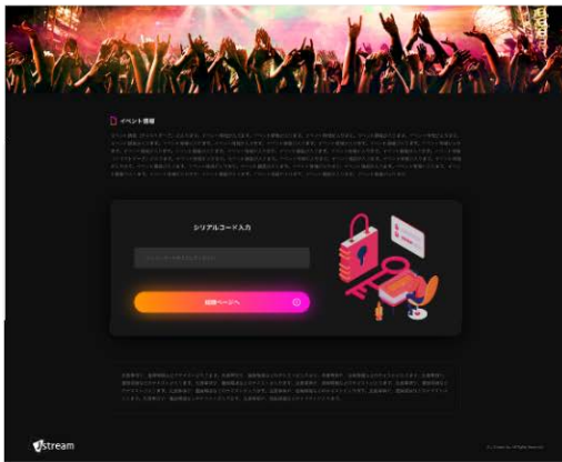
シリアルコード入力画面

株式会社Jストリーム(東証グロース:4308 代表取締役社長:石松 俊雄、以下Jストリーム)は、商品購入のインセンティブとして限定動画などを配信する「動画配信型マストバイキャンペーン」ソリューションの提供を開始したことをお知らせいたします。