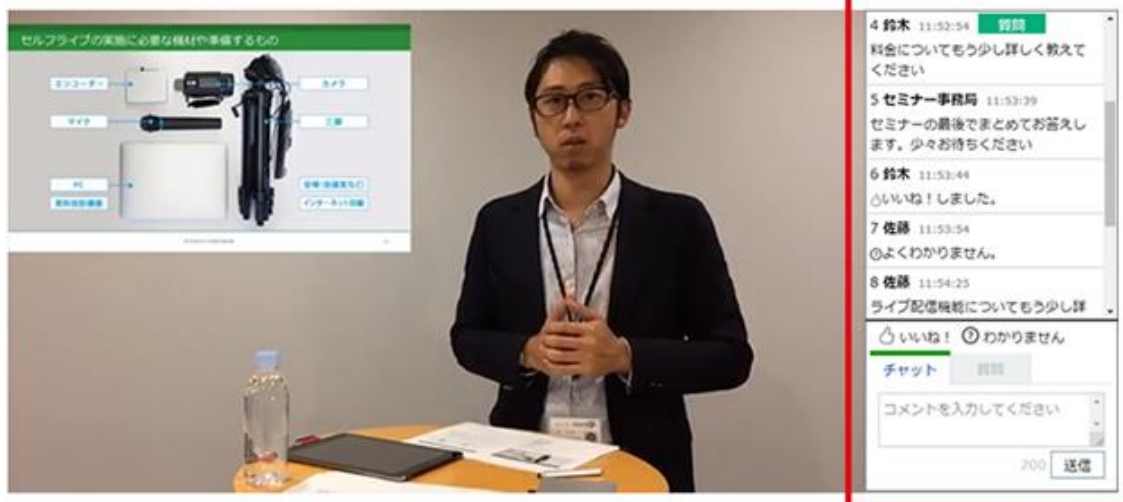
ライブ用チャット機能 視聴画面

【 機能紹介Blogページ : https://www.stream.co.jp/resources/blog/2019/02/08/2444/ 】